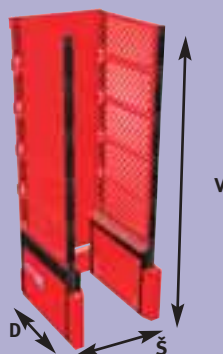
PALMANAGER PRO 24/24/20 PALET

Šířka verzí Multi: šířka palety 800 = 1190 mm, šířka palety 1000 = 1390 mm, šířka palety 1200 = 1590 mm, Další rozměry najdete v tabulce